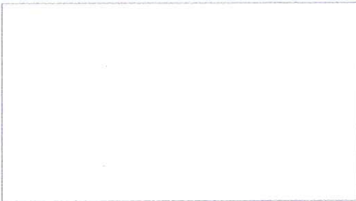
F1: Fachada principal