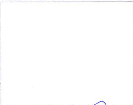
F3: Fachada posterior