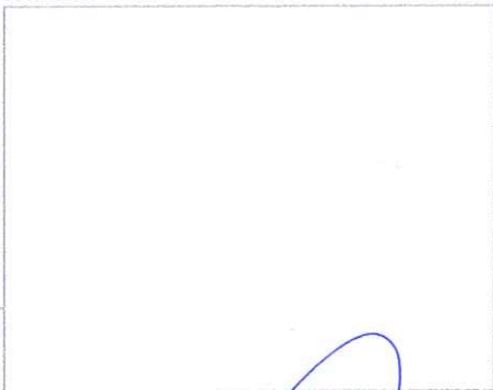
F3: Fachada posterior